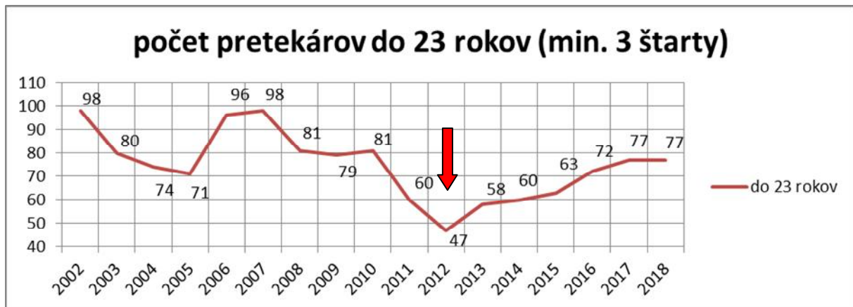
Graf 1. Počet pretekárov do 23 rokov vrátane s minimálne 3 pretekmi ročne

Napriek viacerým výzvam a prosbám, niektoré z klubov doposiaľ nedodali chýbajúce údaje, ktoré sú z pohľadu zákona o športe povinné. Stav na konci roku 2018: z celkovo 1371 registrovaných členov chýbajú údaje o 154, t.j. 11,23 %.