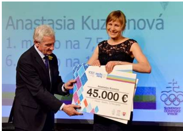
Za obhajobu olympijského zlata v pretekoch na 7,5 km dostala biatlonistka Anastasia Kuzminová z rúk prezidenta SOV Františka Chmelára symbolický šek na 45 000 eur.

Symbolické šeky na večere olympionikov odovzdávali predstavitelia Slovenského olympijského výboru na čele s prezidentom SOV Františkom Chmelárom , zástupcovia niektorých marketingových partnerov SOV a Slovenského olympijského tímu Soči ( TIPOS, Mercedes-Benz, Západoslovenská energetika ), ako aj ministerstva školstva, vedy, výskumu a športu SR na čele s ministrom Dušanom Čaplovičom .