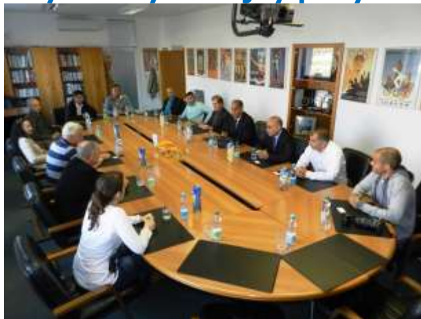
Momentka z návštevy izraelskej delegácie v sídle SOV.