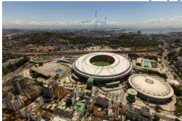
Legendárny futbalový štadión Maracanã v Riu de Janeiro.

Rio de Janeiro 14. apríla (TASR) - Približne 2500 robotníkov stále neprerušilo štrajk a nepokračuje v prácach na výstavbe Olympijského parku, ktorý bude hlavným dejiskom OH 2016 v Riu de Janeiro . Robot-